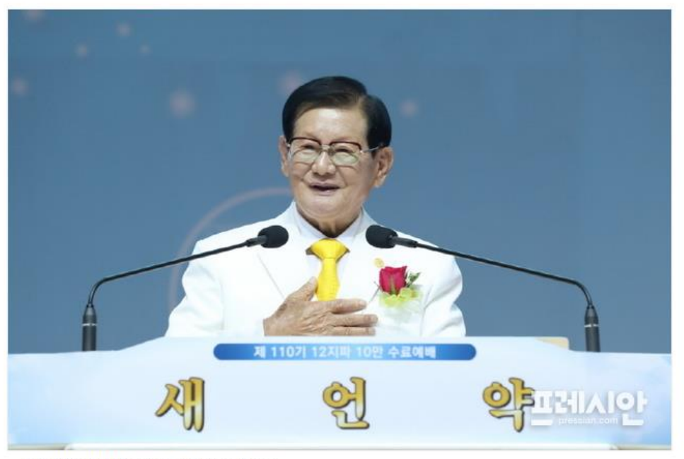
▲이만희 신천지예수교 총회장.

신천지 10만 명 수료, 세계적으로 유례없는 일 이만희 총회장 "하나님의 가족과 자녀로서 영광되는 빛이 돼야..." <sup>김종성 기자(=경남)</sup>