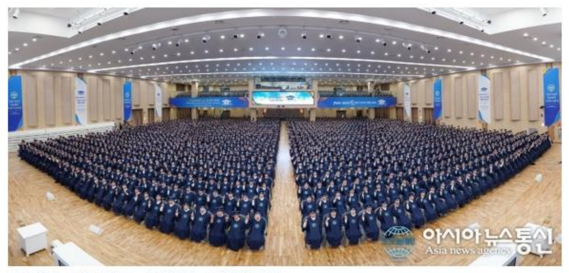
부산 지역 수료식 모습.

지난 1990년대 이후 기독교 교인 수가 급속도로 줄어들고 있는 상황에 견주어 보면 이러한 신천지의 성장은 국내 뿐 아니라 전 세계적으로도 유례가 없는 일이다. 이날 행사는 종교계의 지각변동을 예고했다.