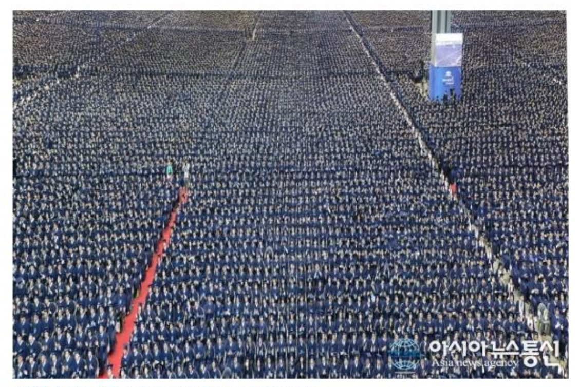
신천지예수교 10만 수료식.

신천지예수교회 관계자는 "전 세계적으로 10만명이 동시에 수료한다는 것은 전무후 무한 사건이다"면서 나아가 "현재 20만명 이상이 이미 시온기독교선교센터 과정을 밟고 있다. 이 흐름대로라면 신천지는 앞으로 3년 안에 100만명 이상으로 성도수가 늘어날 전망이다"고 밝혔다.